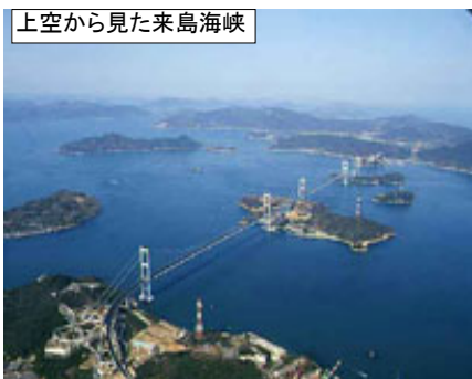
上空から見た来島海峡